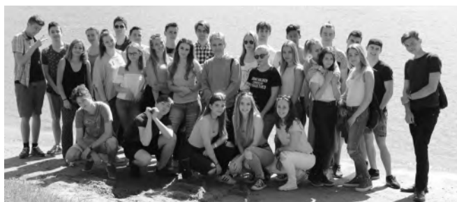
10.A osztály osztálykiránduláson