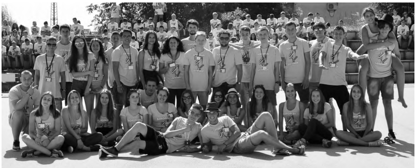
Diákönkormányzatunk a 2016-2017-es tanévben