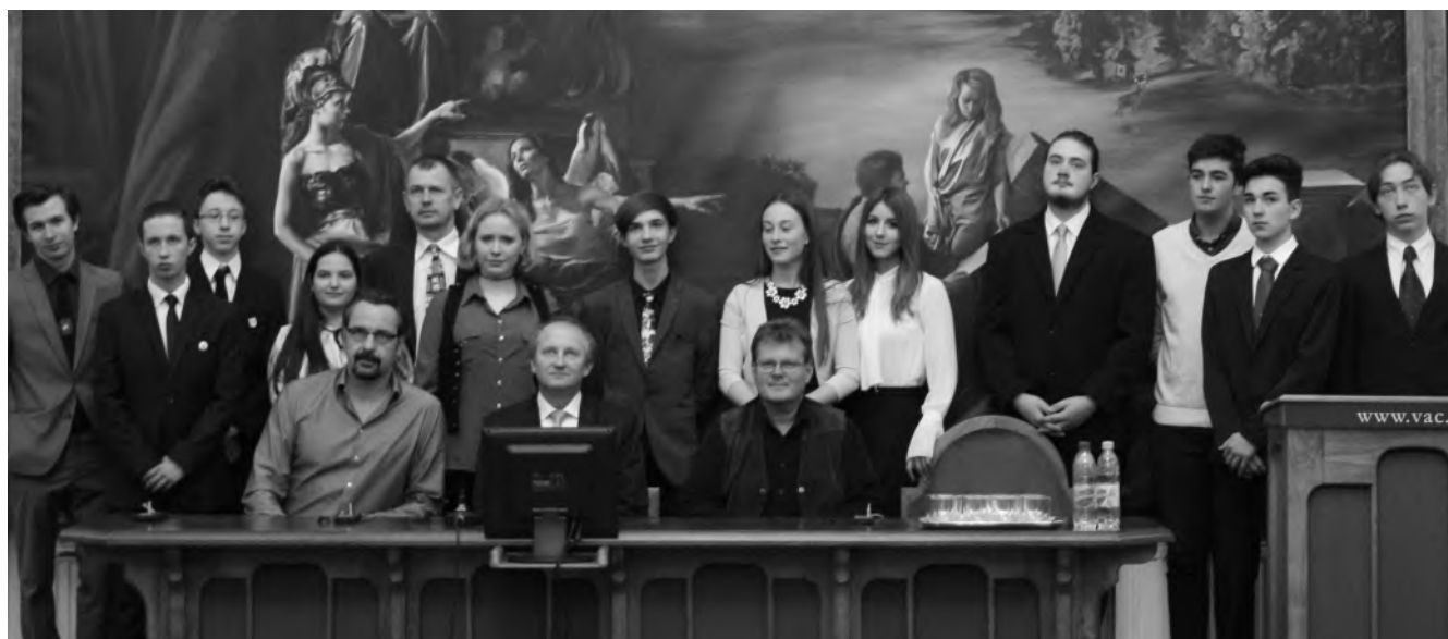
Kárpát-medencei Kölcsey Ferenc szónokverseny