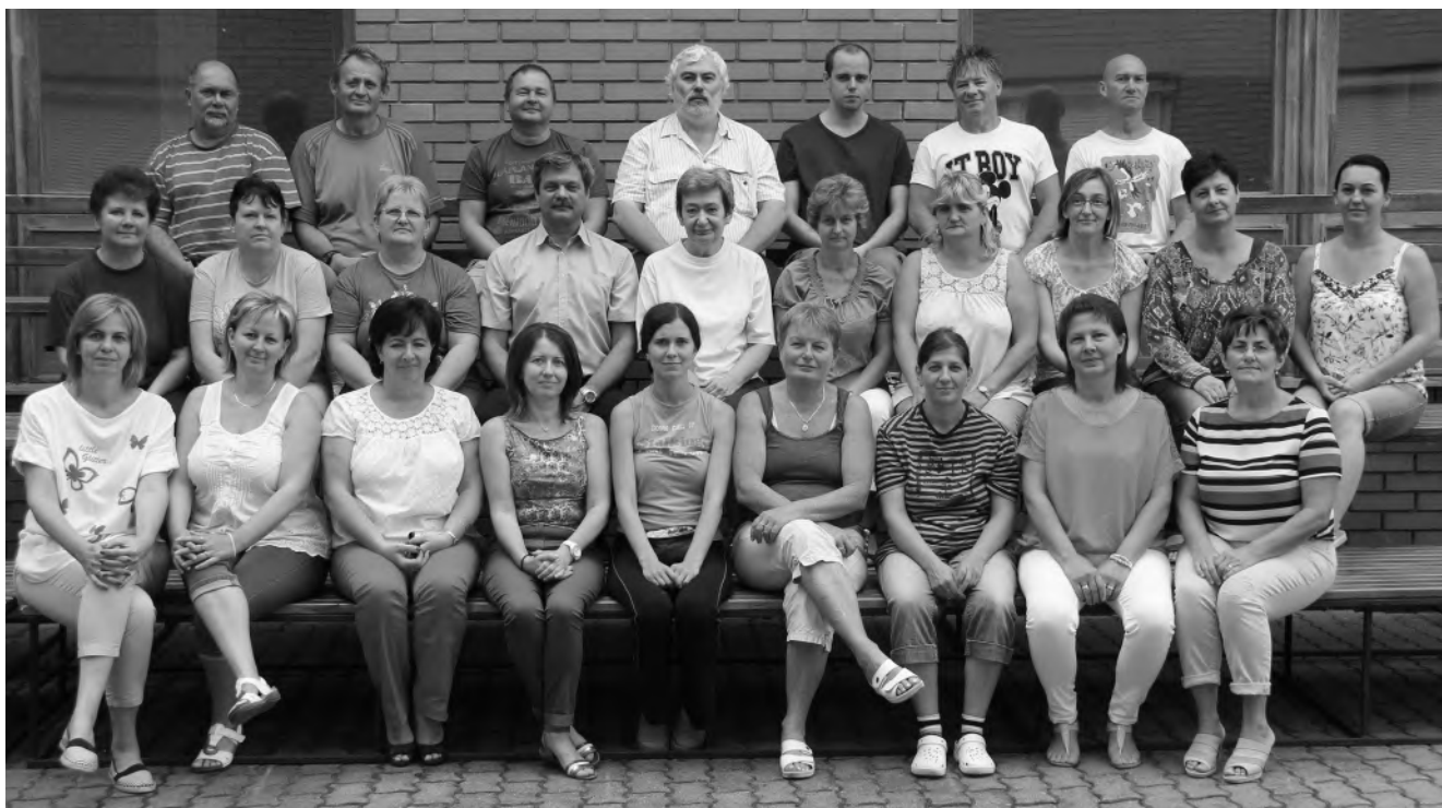
Technikai dolgozók csoportképe

Hosszú évekre visszamenőleg elmondható, hogy mindig voltak olyan tanáraink, akik országos szintű elismeréseket vehettek át, elsősorban a tehetséggondozó tevékenységükért. Emellett mindig jutott nekünk ilyen az intézményi kategóriában is. Nagy megtiszteltetésnek tekintjük a megyei és városi szinten adományozott díjakat is. Természetesen büszkék vagyunk a diákjaink által átvettekre is, bár ezek közül néhányról nem vagy csak késve szerzünk tudomást.