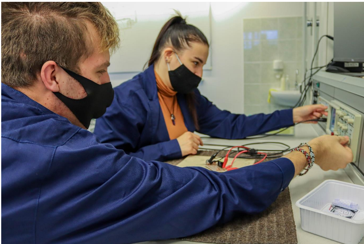
Elektrotechnika gyakorlat, váltakozó áramú körök mérése.