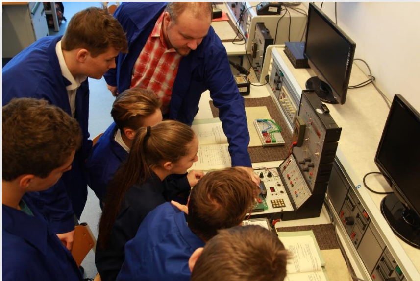
Elektronika gyakorlat, mérési feladat ismertetése, megbeszélés.