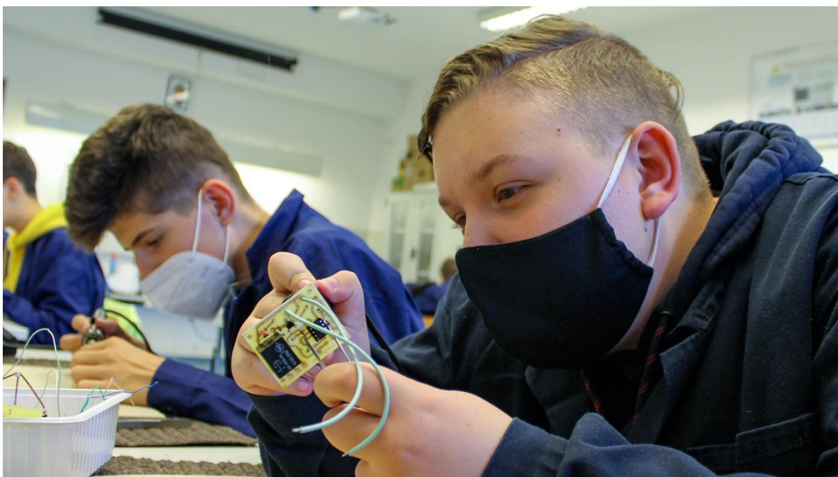
Elektronika gyakorlat, billenő áramkör építése integrált áramkörrel.