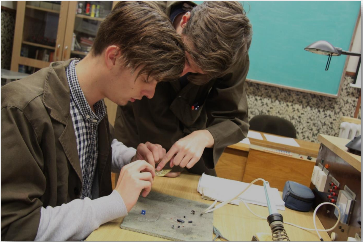
Áramkörök építése, üzemeltetése