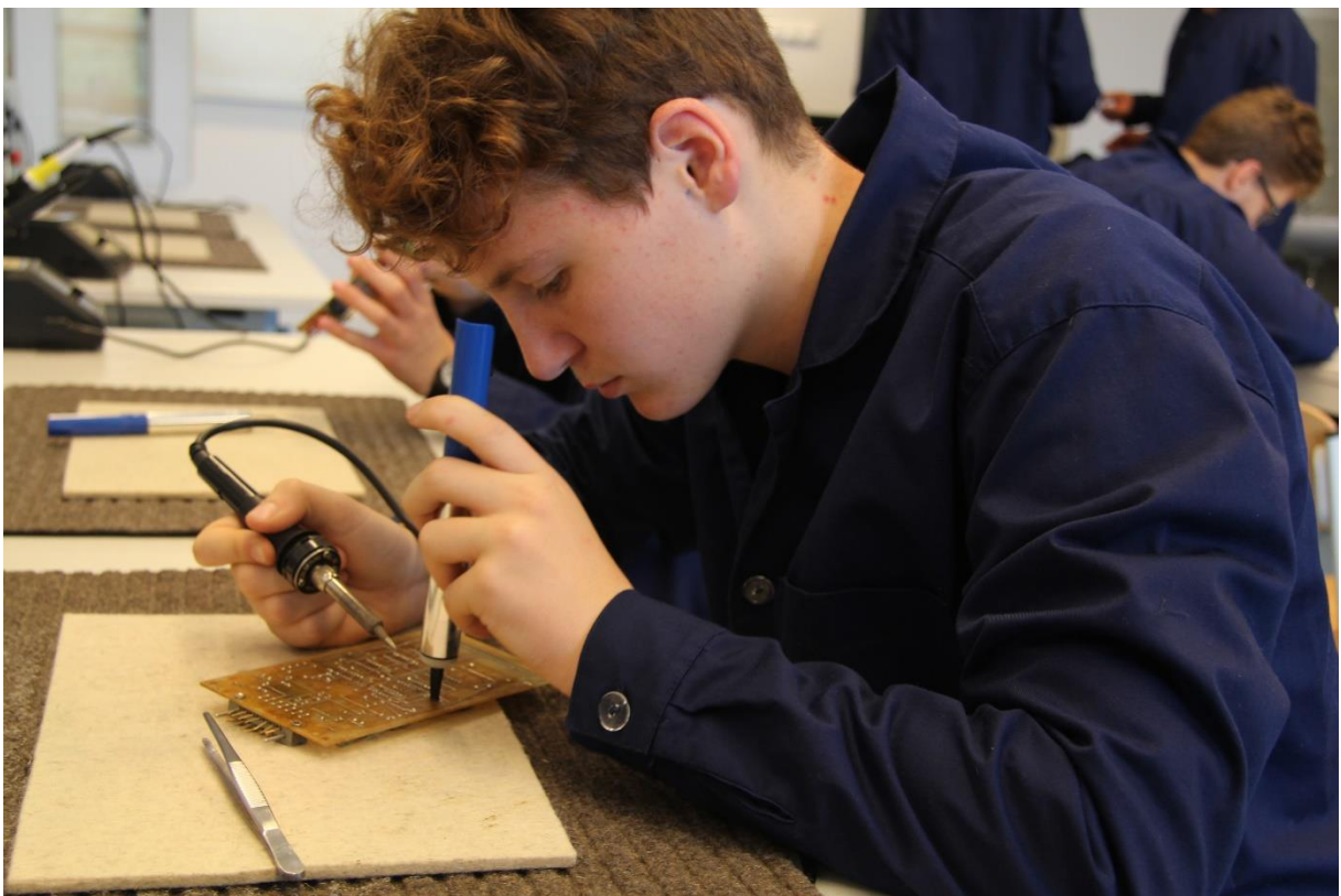
Elektronika gyakorlat, hibakeresés, javítás